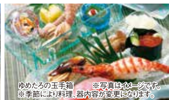
ゆめたるの玉手箱 ※写真はイメージです。 ※季節により料理、器内容が変更になります。